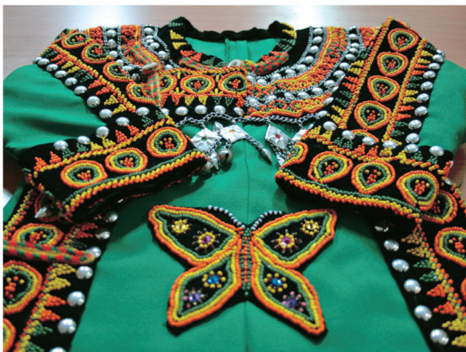
排灣族傳統服飾

展望未來，原住民族教育努力之方向，應繼續強化各族群的自我認同感，增進自我策劃與增能，促進族群實質公平機會，並平等對待族群之差異。促進多元族群間之互信與互助，尊重不同文化之內容。展現不同民族文化形態，並接納其他族群之特質，以實現共同合作創造美好國家形象，及增進族群競爭力之理想與願景。