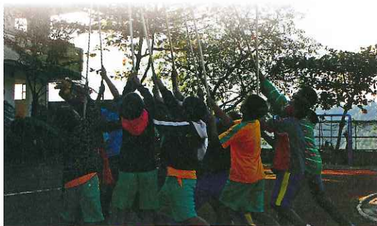
排灣族刺球活動

本白皮書之架構以緒論（第一章）為前導說明，以國民（含學前）教育、高中職教育、高等教育、師資培育、終身及家庭教育、民族教育等教育階段及類別分節論述原住民族教育之實施內涵，說明原住民族教育現況（第二章），分析原住民族教育問題（第三章），進而提出解決問題之發展策略（第四章），並展望原住民族教育願景（第五章）。