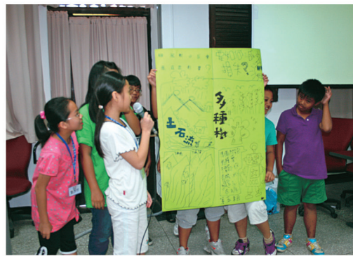
原住民小朋友了解大自然對環境的重要性

原住民族教育為國家教育重要內涵，我國「憲法」增修條文第 10 條第 11 項：「國家肯定多元文化，並積極維護發展原住民族語言及文化。」同條第 12 項：「國家應依民族意願，保障原住民族之地位及政治參與，並對其教育文化、交通水利、衛生醫療、經濟土地及社會福利事業，予以保障扶助並促其發展…。」「原住民族基本法」第 7 條：「政府應依原住民族意願，本多元、平等、尊重之精神，保障原住民族教育之權利；其相關事項，另以法律定之。」「原住民族教育法」第 1 條：「根據憲法增修條文第 10 條之規定，政府應依原住民之民族意願，保障原住民之民族教育權，以發展原住民之民族教育文化，特制定本法。」第 2 條：「原住民為原住民族教育之主體，政府應本於多元、平等、自主、尊重之精神，推展原住民族教育。原住民族教育應以維護民族尊嚴、延續民族命脈、增進民族福祉、促進族群共榮為目的。」原住民族教育事務，從教育政策、教育制度、施政計畫乃至配套規劃等均有法律保障與規範。