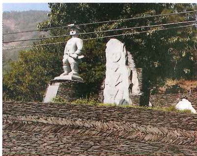
石板牆 (國立屏東教育大學原教中心提供)

(四) 自 97 年起，持續扶助臺北縣(現新北市)、桃園縣、苗栗縣、新竹縣、臺中縣、南投縣、嘉義縣、臺南縣、高雄縣、屏東縣、宜蘭縣、花蓮縣、臺東縣等推動夜光天使點燈專案計畫，針對弱勢家庭學童提供夜間課後教育輔導，原住民族受益學童累積達 3 千餘名，提供弱勢原住民族家庭支持與協助，並自 102 年起結合課後照顧政策積極辦理。