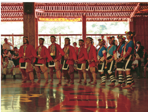
鄒族的歌