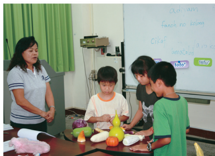
學習原住民族語