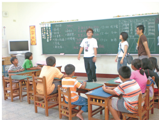
原住民族大專生至偏遠國小暑期輔導