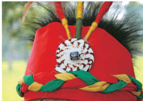
原住民族小朋友的頭飾

87 年政府頒布「原住民族教育法」，保障原住民族的教育權，各式專門為原住民族編寫的教材在短時間蓬勃發展。89 年教育部將本土語言（臺灣閩南語、客語、原住民族語）納入正式課程。92 年頒布「國民中小學九年一貫課程綱要」，其中選修課程類別提到「國小 1 年級至 6 年級學生，應就閩南語、客家語、原住民族語等 3 種本土語言任選 1 種修習，國中則依學生意願自由選擇修習。」自此本土語言已列入語文領域，並占「語文學習領域」之