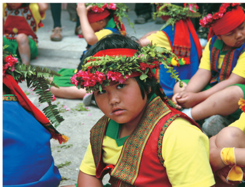
魯凱族小朋友