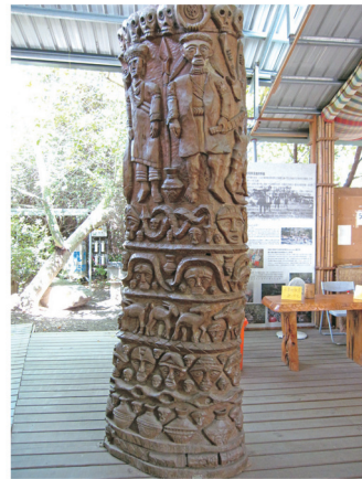
原住民族藝術雕刻

學校中的民族文化教育課程在開課時多以考慮能否聘請到講師、有無申請到補助計畫，或是學校發展的特色是什麼，所以，各年度所開之課程常有不連貫之情形，例如今年學習舞蹈、明年學習編織，很難提供給學生完整且深入的民族文化。又各縣市原住民族部落大學各年度開設連貫性的課程也不多，例如開設文化課程中的美食課程或編織課程，最多只開設一學期，少數會開到二學期的課程。每一種知識或能力的習得，若欲達到精熟程度，勢必需經長時間的訓練，但細察學校或部落大學的民族教育課程之開設均缺少系統性的規劃，對民族文化的復振就不易落實。