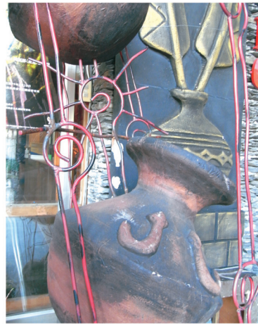
原味裝飾 (國立屏東教育大學原教中心提供)

100 學年度第 2 學期原住民族大專校院學生休學人數 1,970 人 ( 男生 966 人、女生 1,004 人 )，休學率為 8.87%；一般生休學人數 88,602 人 ( 男生 52,240 人、女生 36,362 人 )，休學率為 6.66%，原住民族學生休學率高於一般學生 2.21 個百分點 ( 表 14)。