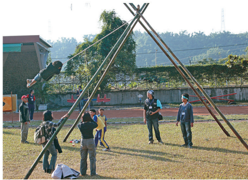
原住民盪鞦韆遊戲